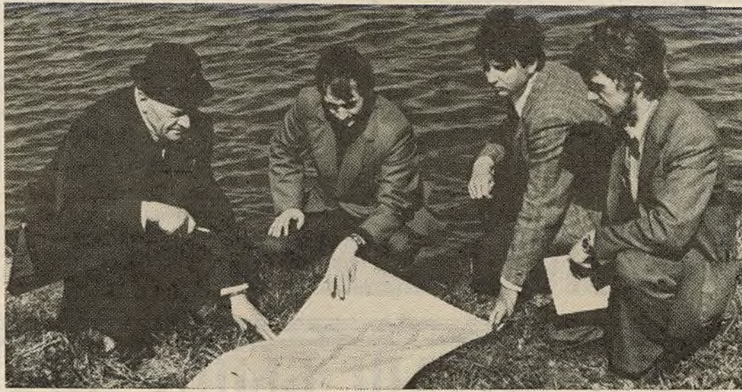
Цесныя творчыя сувязі існуюць паміж навуковымі супрацоўнікамі праблемнай лабараторыі меліярацыі ландшафтаў БДУ імя У. І. Леніна і Беларускай сельскагаспадарчай акадэміі. На працягу многіх гадоў яны сумесна выконваюць дагавор аб навуковым супрацоўніцтве па пытанню меліярацыйнай рэканструкцыі і фарміраванню культурных ландшафтаў у